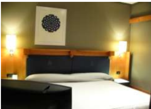
Dormitorio (Cama King Size)