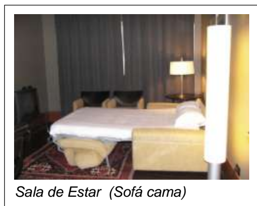
Sala de Estar (Sofá cama)